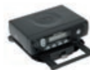
Kieszon do radiotelefonu

Uniwersalna seria Commercial jest szczególnie przydatna dla następujących rynków: firmy transportowe, przewozowe, kurierskie oraz dostawcze, w których szybki przepływ informacji determinuje prawidłowe funkcjonowanie. Opcje montażu pozwalają na szybkie i łatwe wyjęcie radiotelefonu, gdy nie jest on używany. Dla organizacji rolniczych i służb ochrony środowiska – samotni pracownicy są chronieni poprzez wbudowany system bezpieczeństwa, więc pomoc lub rada kolegów jest dostępna dzięki naciśnięciu jednego przycisku. Podczas działań władz lokalnych, komunikacja „jeden do jednego“ jest optymalna dla łączności pomiędzy zarządzającym a podwładnym, bez konieczności absorbowania innych pracowników.