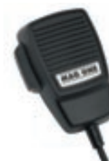
Mikrofon „Mag One“