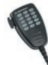
Mikrofon z klawiaturą