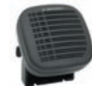
Zewnętrzny głośnik 13W